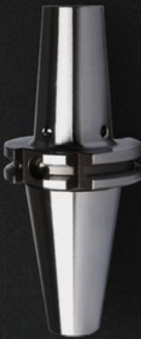
POWER MILLING CHUCK