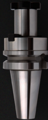
END MILL HOLDER