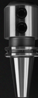
SK SLIM CHUCK