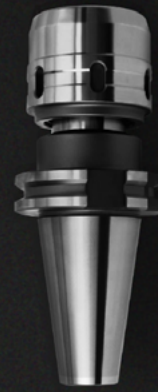
TAPPING ER CHUCK