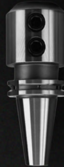
SK SLIM CHUCK