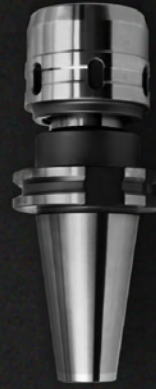
TAPPING ER CHUCK