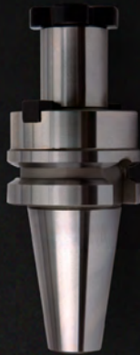
END MILL HOLDER