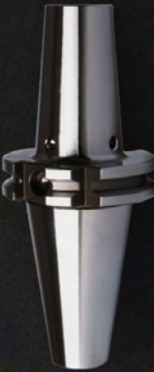
POWER MILLING CHUCK